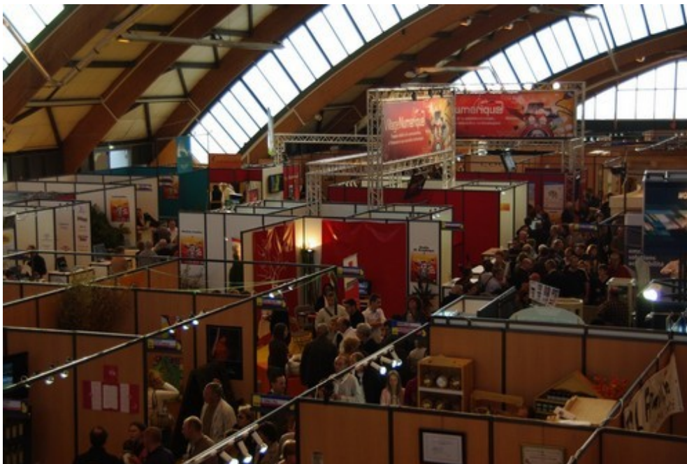
Village Numérique Jur@ticsur le Salon Made in Jura - 2009

Afin de mener à bien ses missions, Juratic a depuis sa création recensé puis animé la filière des professionnels des TIC. Ainsi, à l'occasion du salon « Made In Jura » en 2009, Juratic a installé le « village numérique Jur@TIC » au cœur de l'événement. Plus de 25 professionnels ont présenté leur savoir-faire, montré leur réalisation, animé des ateliers, des conférences à destination des entreprises et des visiteurs.